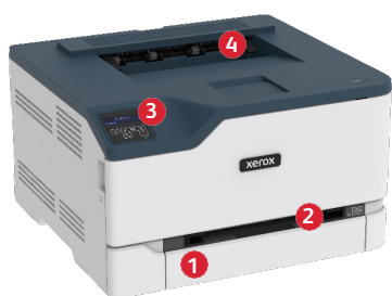
Imprimante couleur Xerox® C230