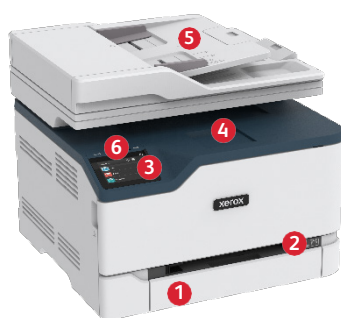
Imprimante multifonction couleur Xerox® C235