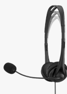
Casque stéréo HP 3,5mm G2 428H6AA