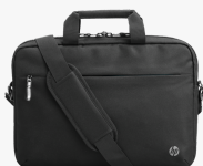
Sacoche pour ordinateur portable HP Professional 14,1 pouces 500S8AA