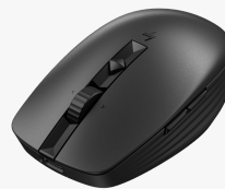
Souris silencieuse rechargeable HP 710 6E6F2AA