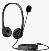
Casque stéréo USB HP G2 428H5AA