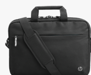
Sacoche pour ordinateur portable HP Professional 14,1 pouces 500S8AA