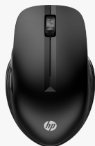
Souris sans fil multi-périphériques HP 430 3B4Q2AA